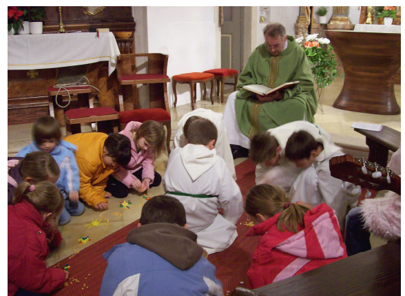
Ich bin da - mit Haut und Haar. Das ist wunderbar! Gott sei Dank!"