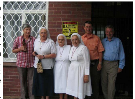
Ihr Kater Karlo

Ein kurzer Besuch am Strand des Indischen Ozeans, es war der heißeste Tag mit 34 Grad im Schatten, und die Sonntagsmesse mit der deutschsprachigen Ausländergemeinde bildeten den Abschluss seiner großen Reise.